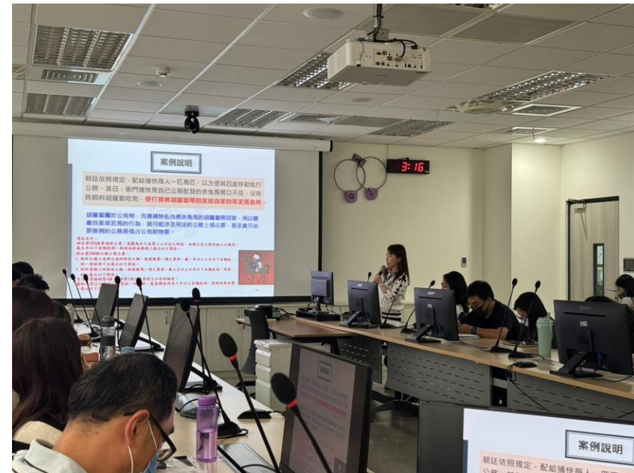
刑法公務上侵占罪、貪污治罪條例公務員侵占公有財物罪解析