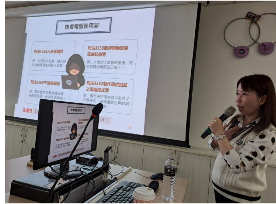
刑法妨害電腦使用罪章