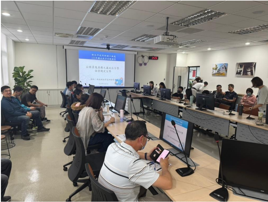
借近期新聞受矚目事件解說法令構成要件及其效果