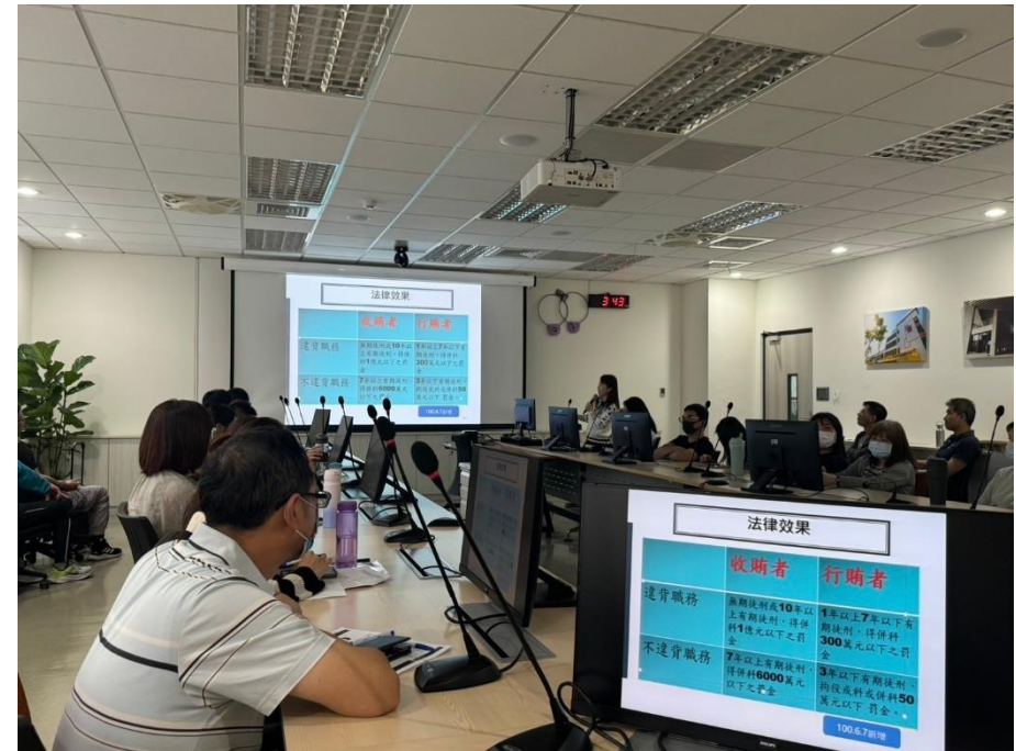
行賄、收賄構成要件及刑責解說