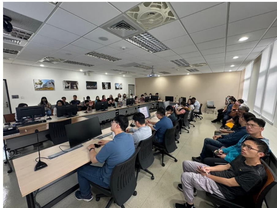
同仁踴躍出席參與課程