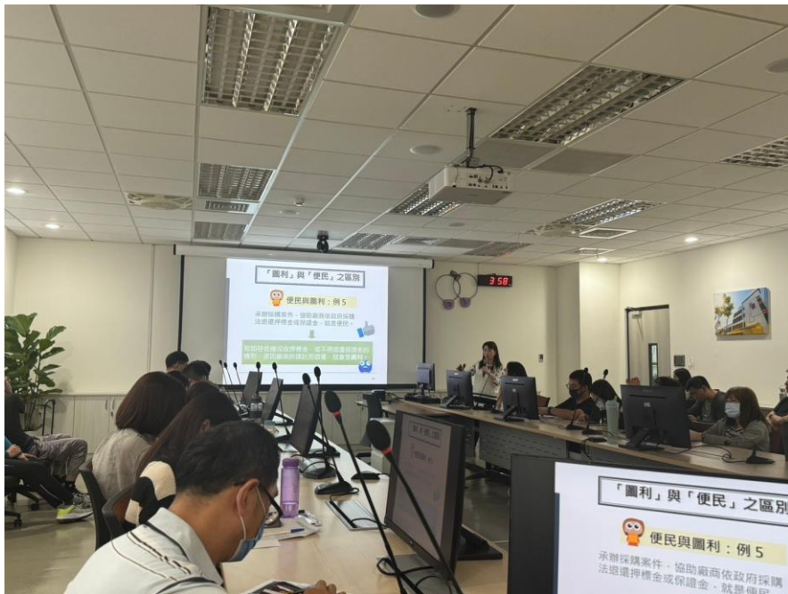
「圖利與便民」之區別