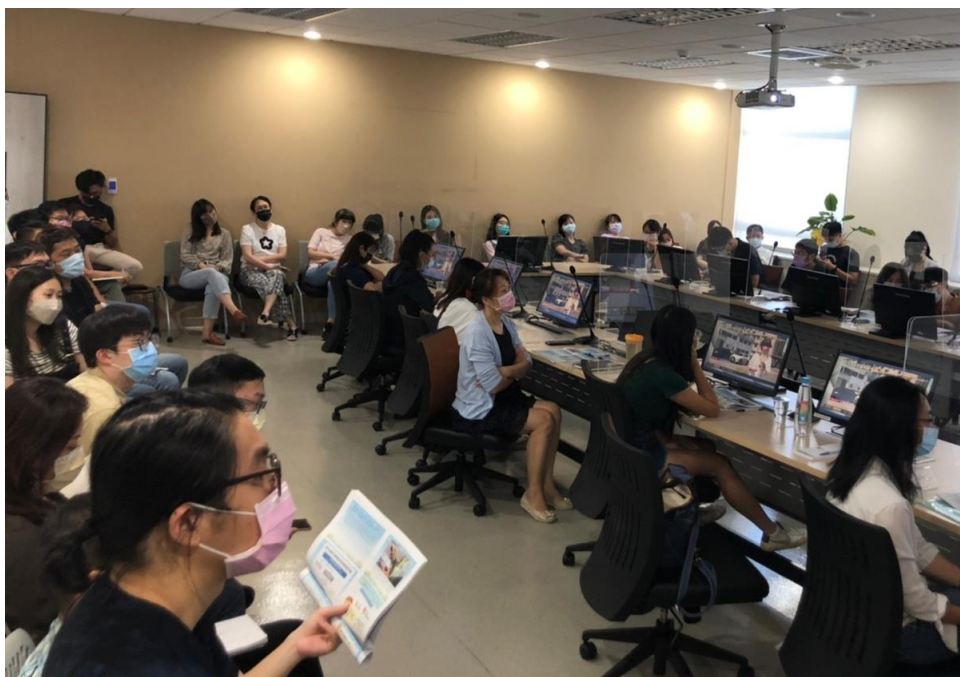
本處同仁聚精會神專心聽講