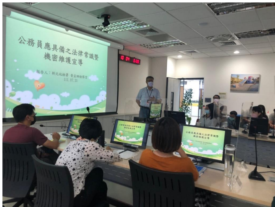
處長出席並致詞勉勵同仁廉能是政府施政的首要要求也是核心價值