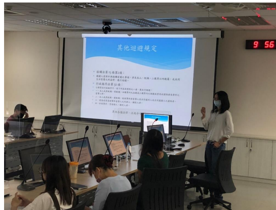
本處政風室宣導利益衝突迴避相關規定