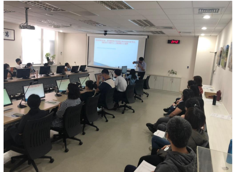
同仁踴躍出席參與課程