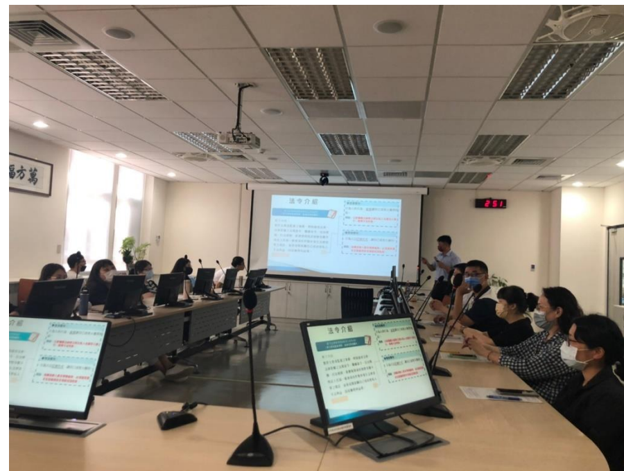
以法令就執行職務之態樣解析圖利與便民之區別