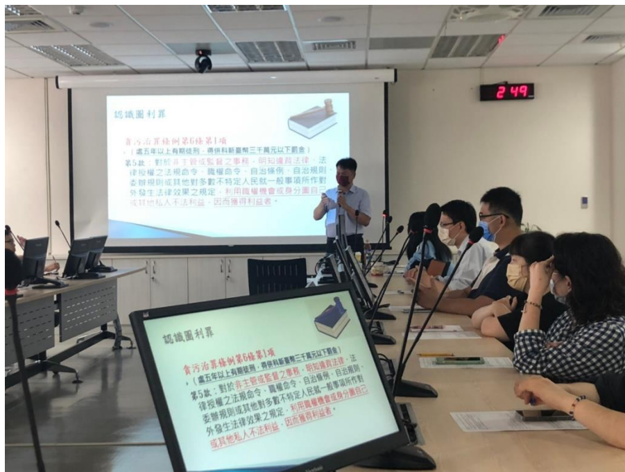
解析貪污治罪條例第6條第1項第5款圖利罪構成要件