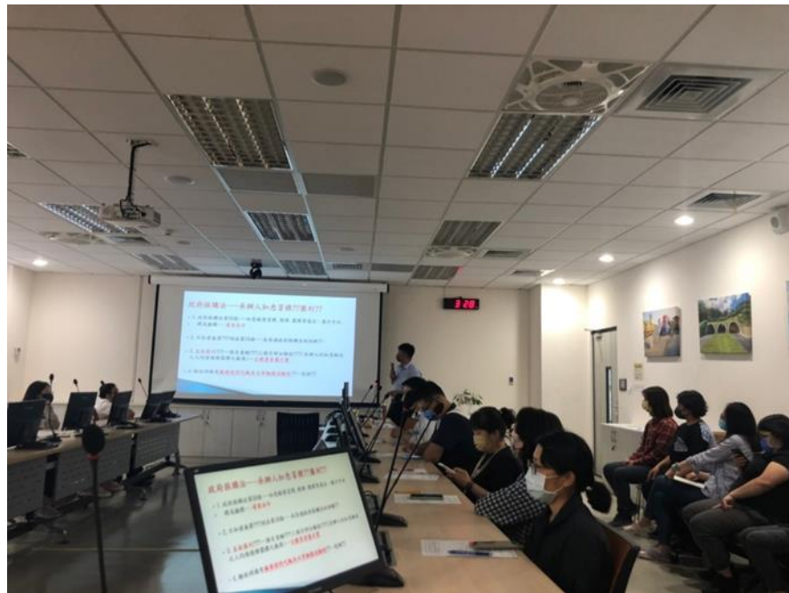
以實務違反政府採購法相關規定案例解析 圖利罪